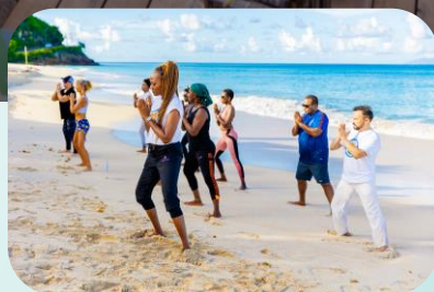
Antigua & Barbuda