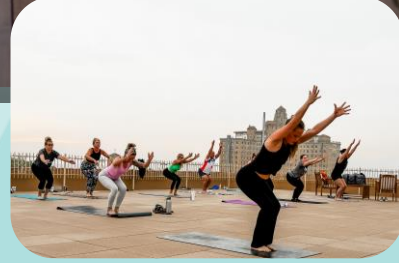
Mineral Wells, TX

È balzata agli onori della cronaca come la destinazione turistica che le persone vogliono esplorare per il benessere..