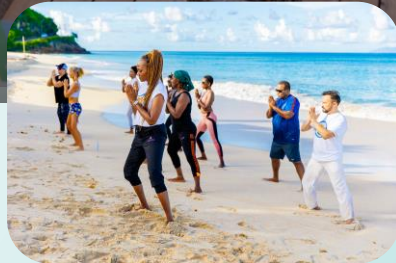
Antigua & Barbuda

Prolungate l'alta stagione con le offerte irresistibili dei vostri partner turistici (associazioni, hotel, club sportivi e di fitness, studi di yoga, attività all'aperto...) a settembre e ottobre.