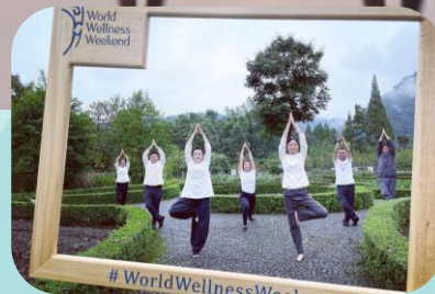
Six Senses Quing Cheng Mountain

Dê as boas-vindas a mais clientes locais com um passe de meio-dia, um brunch de bem-estar, staycation ou programas de adesão personalizados (fitness, ioga, piscina, sauna, almoço...)