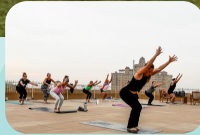
Mineral Wells, TX

Faites la une des journaux en tant que destination touristique de bien-être où les gens veulent visiter, travailler, vivre ou prendre leur retraite.