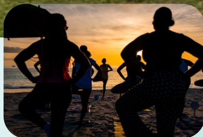
Antigua & Barbuda

Prolongez la haute saison ... en September et Octobre.